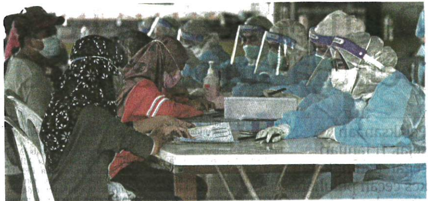
Petugas Jabatan Kesihatan Negeri Terengganu menguruskan pendaftaran saringan COVID-19 penduduk di sekitar mukim Serada di Masjid Kampung Beladau Selat, kelmarin.

kan jumlah kes aktif dengan kebolehhajangan COVID-19 di negara ini sebanyak 66,097 kes.