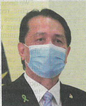
Tan Sri Dr Noor Hisham Abdullah

(97), Terengganu (77), Pahang (54), Perak (30) and Putrajaya (seven). Perlis registered no new cases,” he said in a statement yesterday.