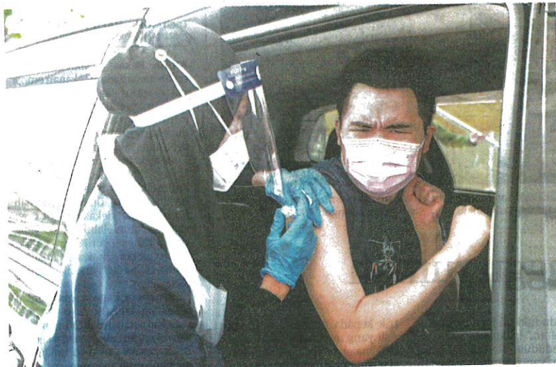
PETUGAS kesihatan Ramsay Sime Darby Hospital memberi suntikan vaksin Covid-19 kepada seorang lelaki di Pusat Pemberian Vaksin (PPV) untuk Orang Kurang Upaya (OKU) secara pandu lalu di Menara Sime Darby Plantation, Kuala Lumpur, semalam.

"Malah Pertubuhan Kesihatan Sedunia (WHO) menyatakan setakat ini Ivermectin