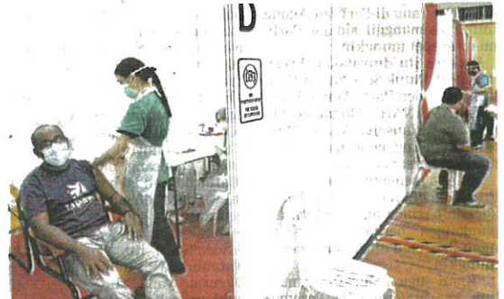
Kerajaan terus meningkatkan kapasiti program vaksinasi agar negara mencapai imuniti kelompok mengikut jadual. (Foto hiasan)

Sarawak mencatatkan Rt 1.00, manakala Negeri Sembilan dengan Rt melebihi 1.0, iaitu 1.03, diikuti Labuan dan Sabah dengan Rt kedua tertinggi, ma-